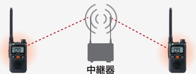
中継器接続で交互通話の約2倍にエリアを拡大

交互通話に加え、中継通話用チャンネルを装備しており中継器に接続することで交互通話の約2倍に通話エリアを拡大できる他、多層階のビル内や別棟との連絡、不感エリアの改善などに利用が可能です。