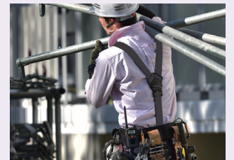
ケーブルレス Bluetooth利用イメージ