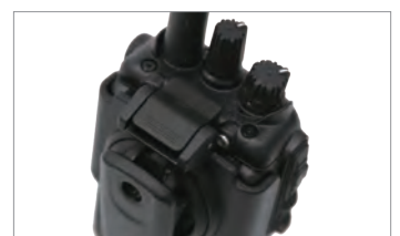
ワンタッチリリースホルスター(SHB-100A)

ベルトに装着したまま、ホルスター上部のフックを押すだけのワンタッチ操作で無線機を外して素早い応答が可能です。通信終了時の無線機の装着もワンタッチで行うことができます。アングルフリー(回転式)のベルトクリップは、作業がしやすい最適な位置に調整ができるので作業の邪魔になりません。