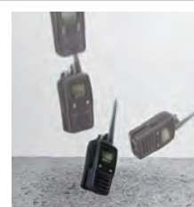
落下試験イメージ

強化エラストマ素材を採用したラバープロテクションケースを装着することによって落下などによる強い衝撃から無線機を保護することができます。ラバープロテクションケースを装着して無線機を2mの高さからコンクリートの床に6方向(上面/底面/左右側面/前面/背面)から落下させる厳しい落下試験をクリアしています。