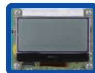
従来モデルの液晶部