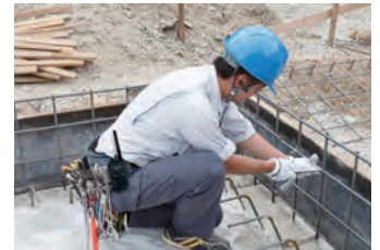
ブルートゥース ハンズフリー使用イメージ