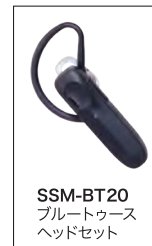
SSM-BT20 ブルートゥース ヘッドセット

注) 市販品全てのブルートゥースヘッドセットの動作を保証するものではありません。 ブルートゥースヘッドセットはSSM-BT20のご使用をお勧めします。