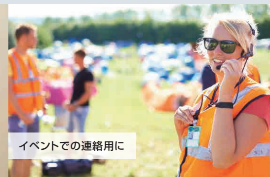
イベントでの連絡用に