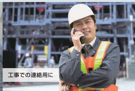
工事での連絡用に